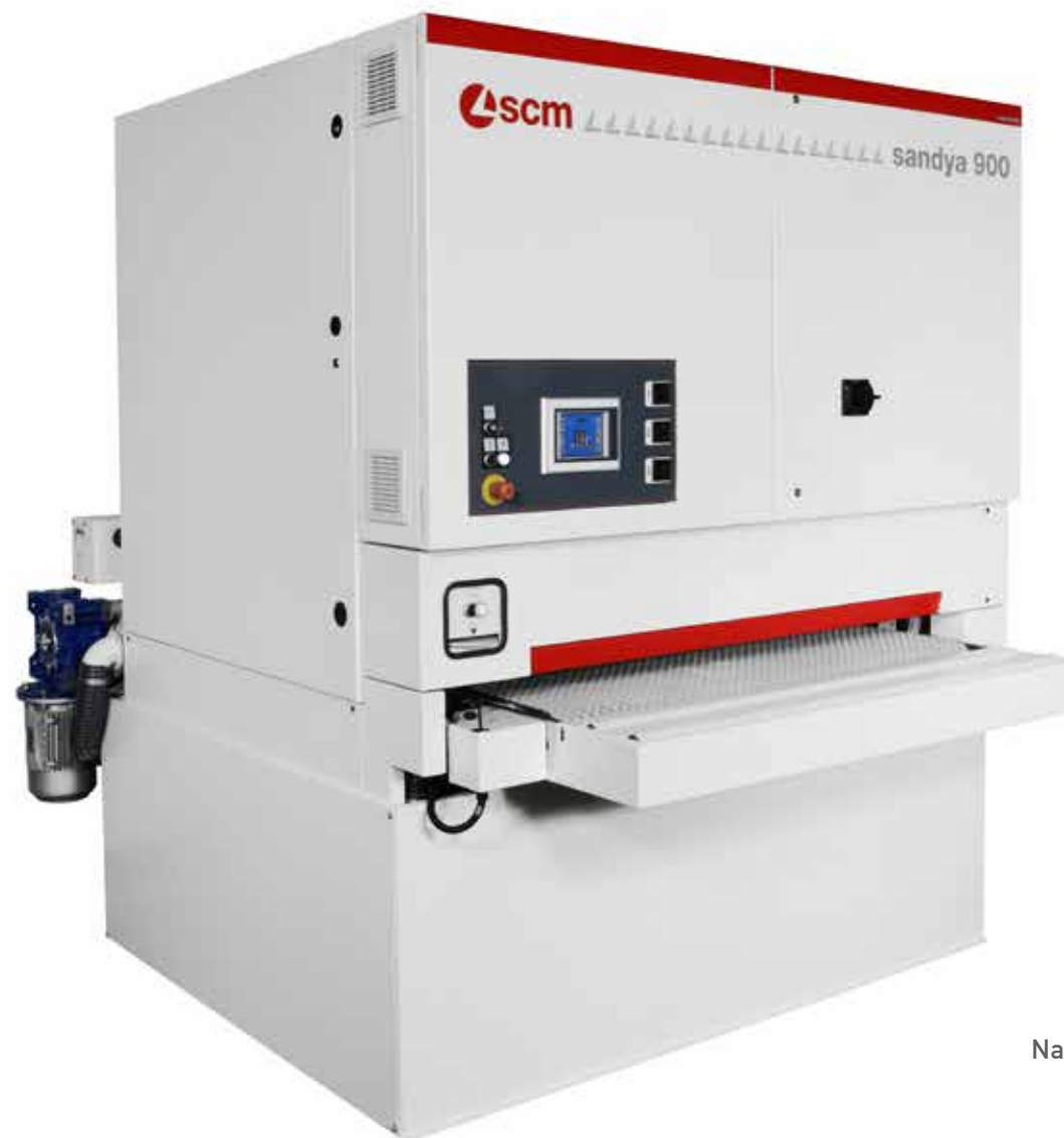
Na slici SCM Sandya 900